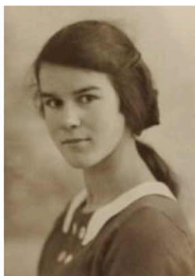
Schrijver: M. Vasalis